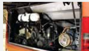
Equipado con motor Mercedes-Benz OM 460 6 cilindros, con certificación EPA 04.