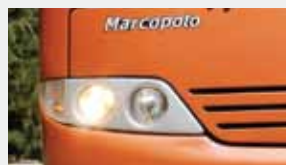
El diseño de la carrocería está basado en el clásico estilo de los Autobuses Mercedes-Benz.