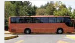
El Andare es un Autobús diseñado y fabricado para viajes seguros y cómodos.

Cada ciudad es un individuo. ¡Nosotros tenemos la solución adecuada para sus requerimientos!