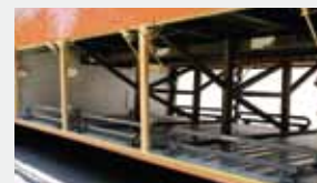
Espacioso maletero pasante entre ejes.